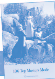
106 Top Masters Mode