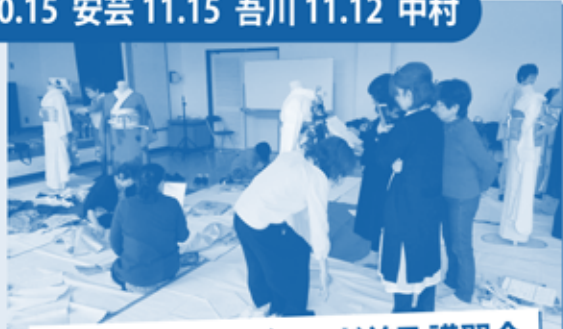
トップマスタースモード普及講習会