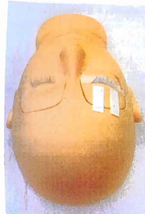
作品見本：イメージ写真